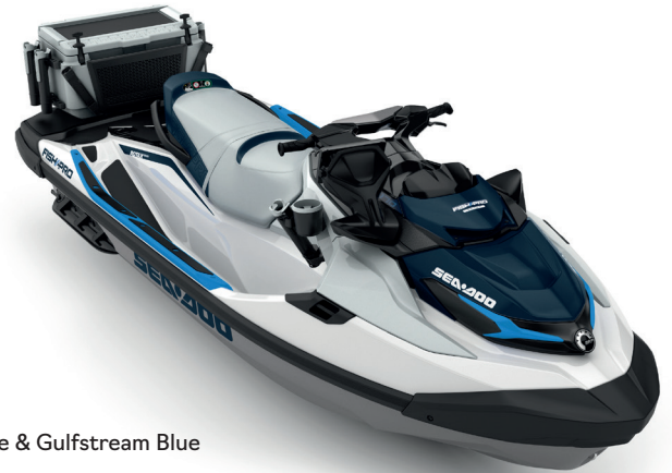
White & Gulfstream Blue