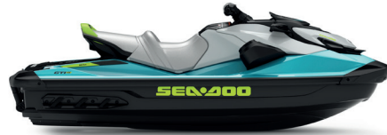
● Teal Blue and Manta Green